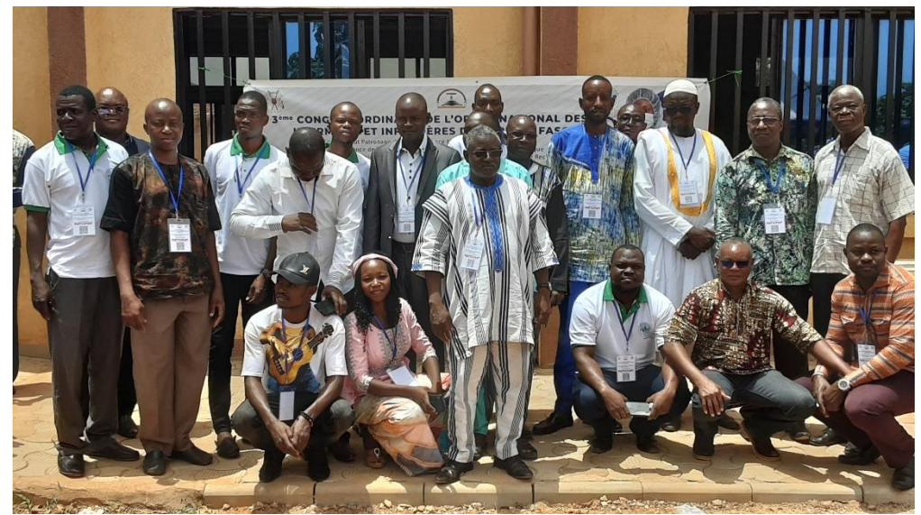
Vue des participants ayant représenté le Conseil Régional de la Boucle du Mouhoun