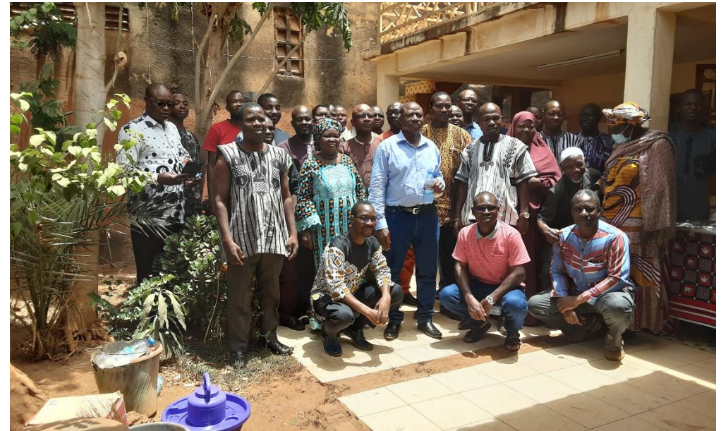
Photo de famille des participants