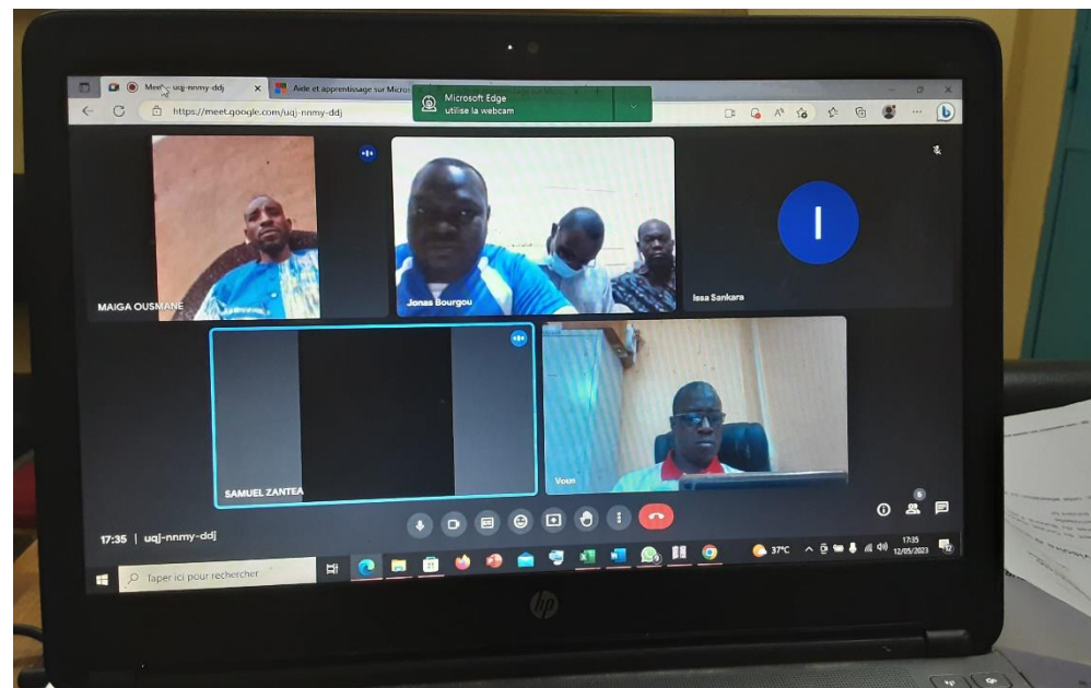
Vue de quelques participants à la réunion Zoom du 12 mai 2023