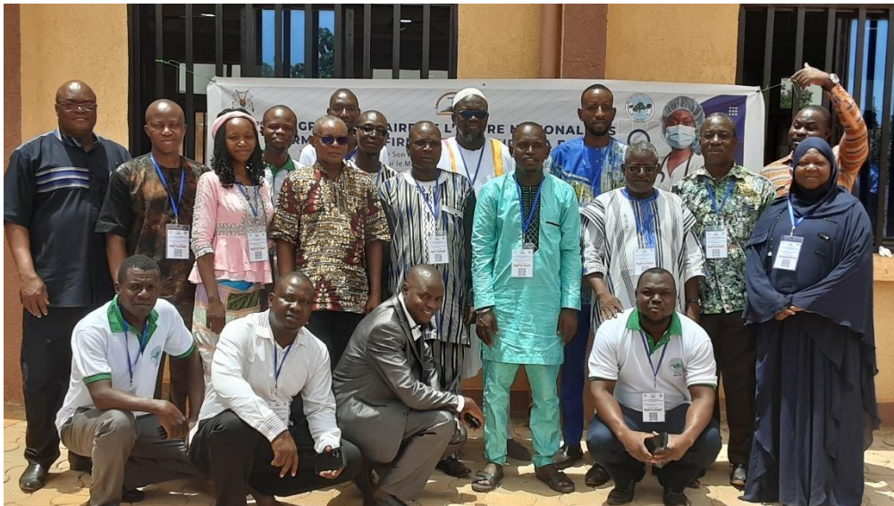
Vue des participants ayant représenté le Conseil Régional de la Boucle du Mouhoun