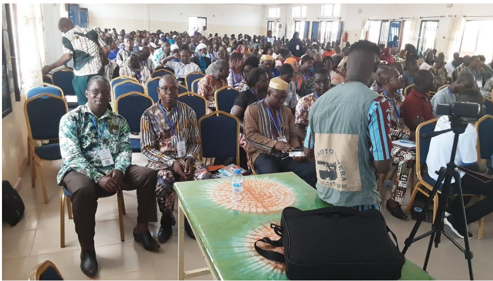
Vue des participants dans la salle de conférence