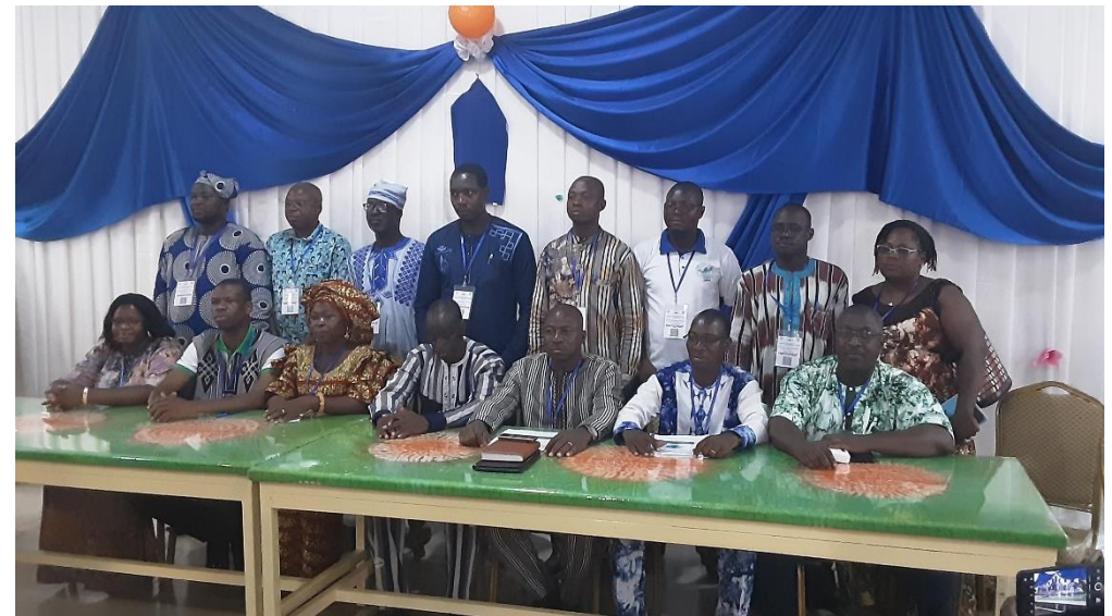
Les membres du nouveau bureau du Conseil National